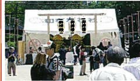
和布刈神社 門司区大字門司 3492

26日 みなとパネル展 (北九州港湾・空港整備事務所1Fロビー) 11:00 ~ 15:00