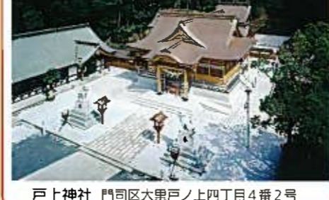
戸上神社 門司区大里戸ノ上四丁目4番2号