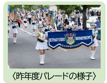
〈昨年度パレードの様子〉