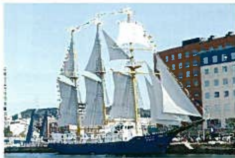
問合せ：北九州港振興協会 TEL 093-321-5900

※一般公開の受付時間は終了時間の30分前までとなっています。 ※天候等により、時間変更・中止の可能性がございます。 あらかじめご了承ください。