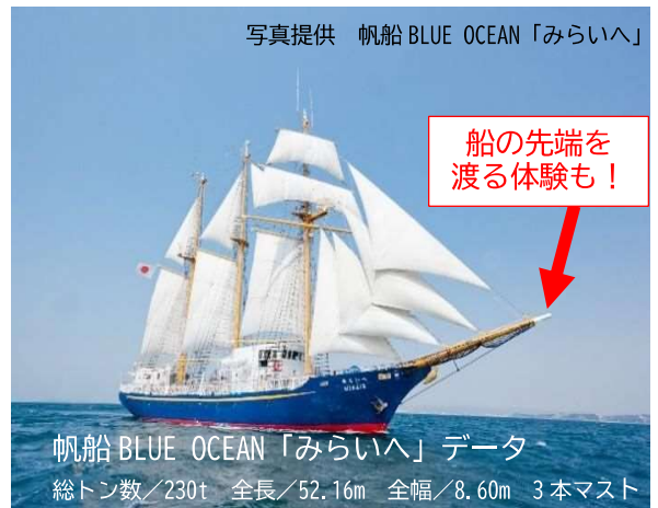
帆船 BLUE OCEAN 「みらいへ」 データ 総トン数/230t 全長/52.16m 全幅/8.60m 3本マスト