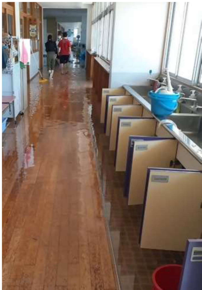
水漏れした手洗い場