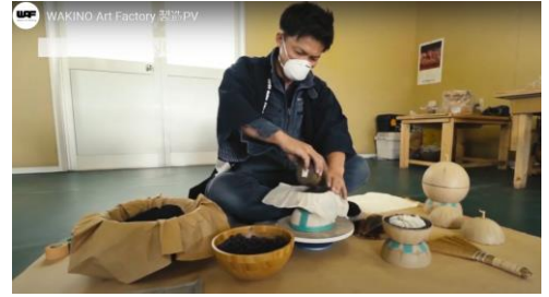
協力:ワキノアートファクトリー(株)