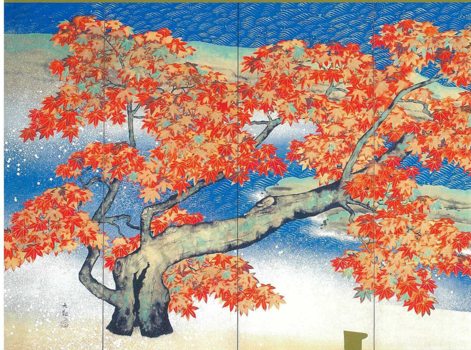
横山大観《紅葉》(左隻-部分) 1931(昭和6)年 足立美術館蔵