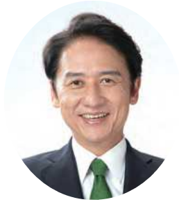
北九州市長 武内 和久