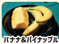
バナナ&パイナップル