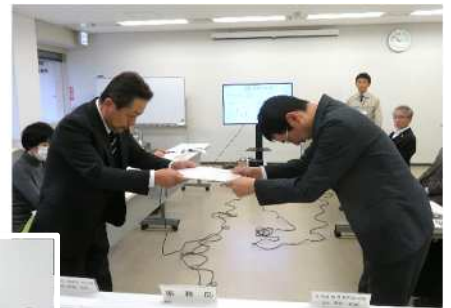
<答申書の受け渡し>