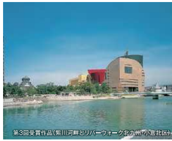
第3回受賞作品(紫川河畔とリバーウォーク北九州(小倉北区))