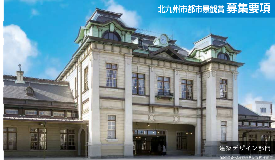
建築デザイン部門