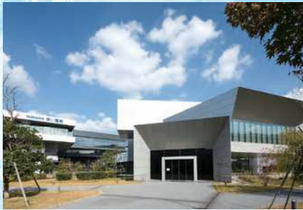
第9回受賞作品(ロボット村(安川電機)・八幡西区)

戸建・集合住宅、商業ビル・店舗等の建築物で、 原則、新築・改修時の建築後、 10年以内に完成したもの