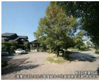
第4回受賞作品 (精華台住宅入居者管理組合の住環境保全活動(若松区))