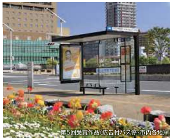
第5回受賞作品(広吉付バス停・市内各地)