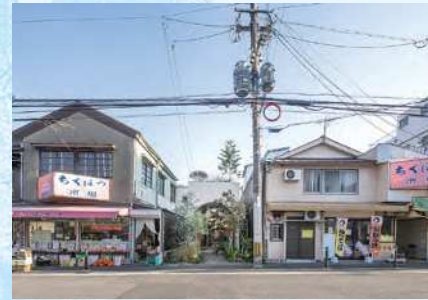
第9回受賞作品(フレンチレストランNALA・八幡東区)