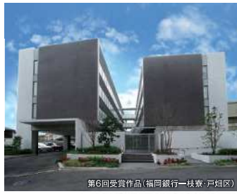
第6回受賞作品(福岡銀行一枝寮・戸畑区)