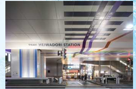
第9回受賞作品(北九州モノレール 平和通駅周辺・小倉北区)