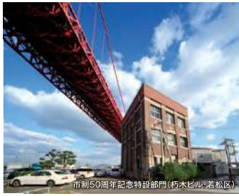
市制50周年記念特設部門(新木ビル・若松区)