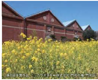
第8回受賞作品(ニッカウヰスキー株式会社 門司工場・門司区)