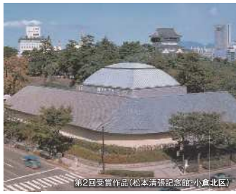
第2回受賞作品(松本清張記念館・小倉北区)