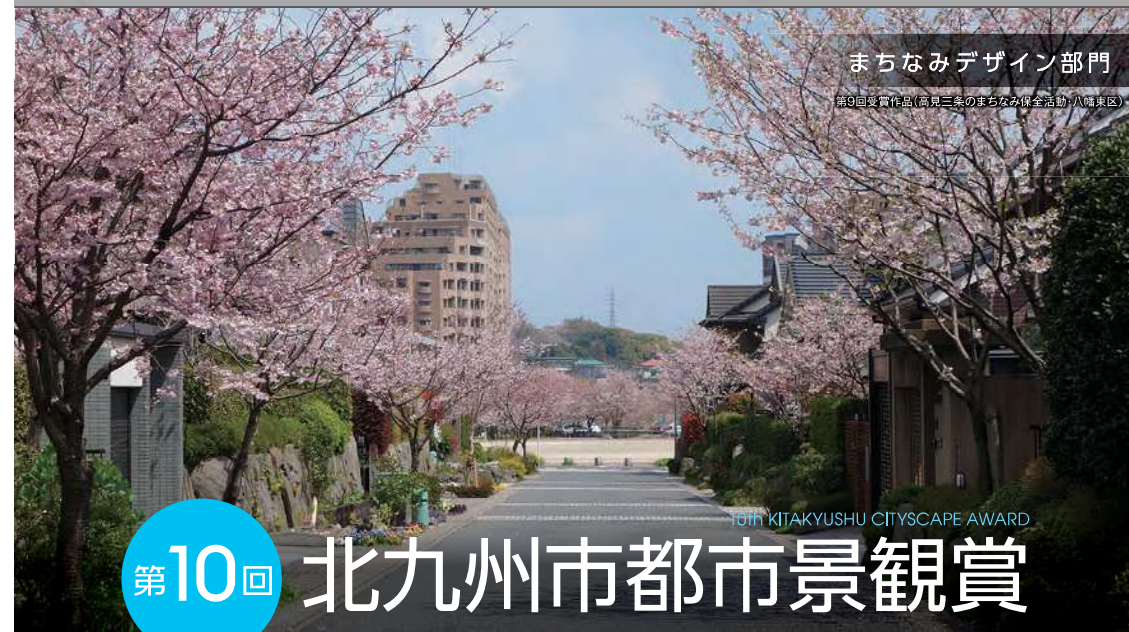
まちなみデザイン部門