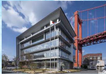
第9回受賞作品(新鶴丸ビル・若松区)