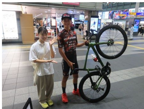
VC FUKUOKA 選手へのインタビュー