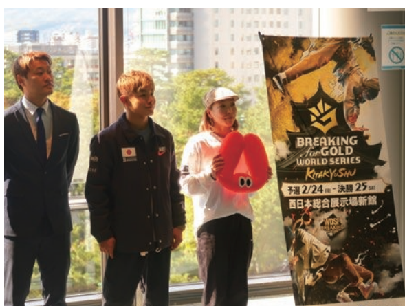
大会記者会見へ出席