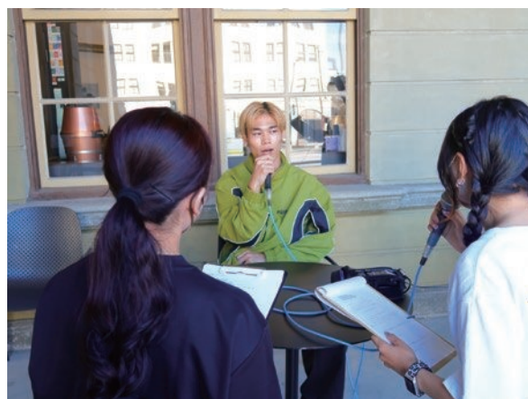
PR 動画出演ダンサーへインタビュー