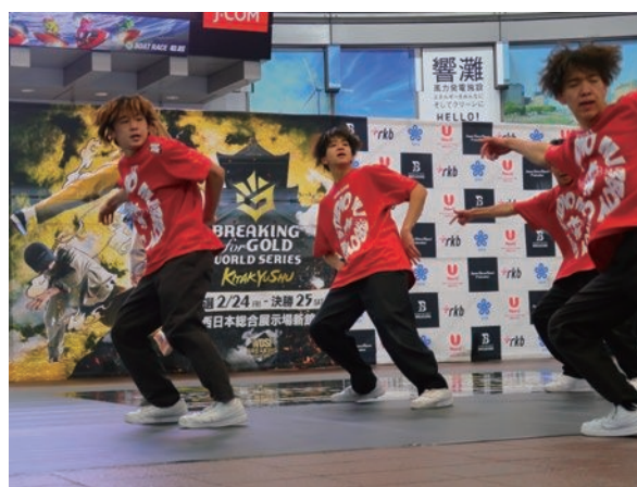
開催1か月前記念イベント取材

取材時におこなったインタビューや取材の感想、ブレイキンについての情報を11月から毎週、番組内のミニコーナーでお伝えしました。あわせてSNSでの情報発信も都度実施しました。