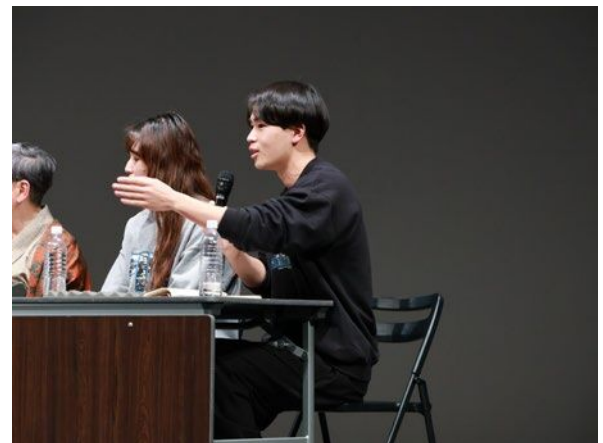
関連イベント出演

若者 PR 団体の一員として北九州国際映画祭 PR の動画を撮影・編集をするなどの経験をしました。イベント開催中も可能な限りプログラムに参加し、放送内や SNS での情報発信を実施しました。