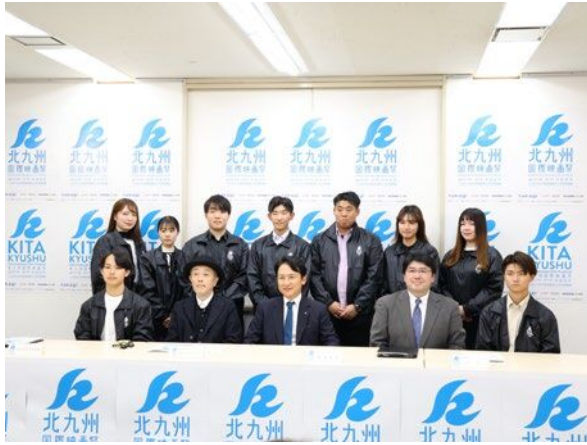
若者 PR メンバーとして 記者会見に参加