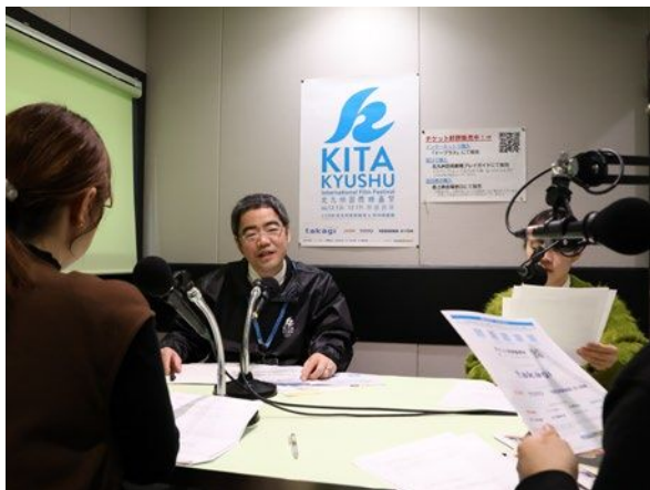
関係者をゲストに迎えての収録