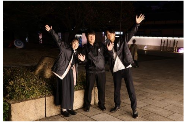
映画祭 PR のための動画を制作