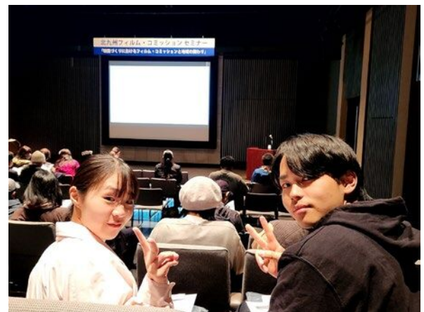
関連イベント取材