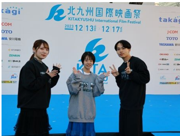
ウェルカムセレモニー取材