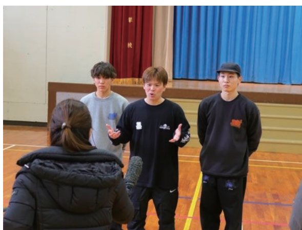
市内学校へのダンスレッスン取材