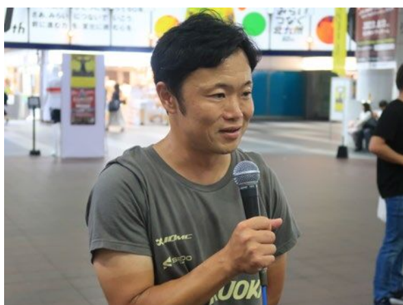
VC FUKUOKA 監督へのインタビュー