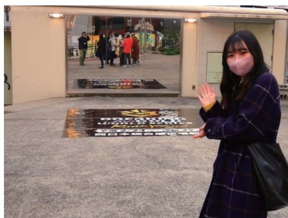
市内フリーブレイキンスポット設置取材