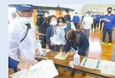
避難者受入れ訓練