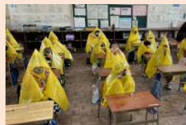
ビニール袋ポンチョ