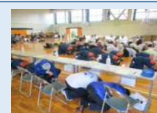
シェイクアウト訓練