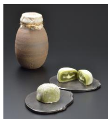
(株)辻利茶舗 抹茶大福