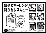
『雑がみレスキュー』シール