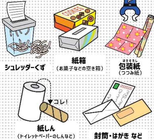
シュレッダーくず