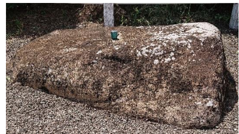
河童の誓文石／武雄市橘町潮見