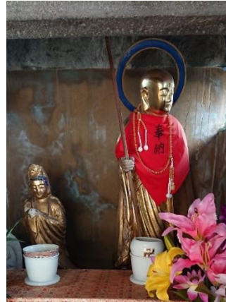
横向き地蔵／長崎市矢の平