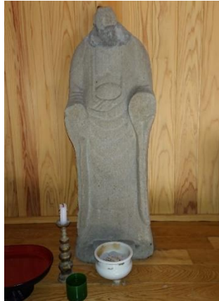
首無し地蔵／飯塚市冷水峠

蔵」と長崎市の「横向き地蔵」は、離れた地でありながら似た内容の言い伝えが残されています。長崎街道を伝って文化等が伝播したように、言い伝えも同様のことが起こったと考えられます。