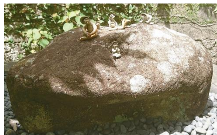
河童石／長崎市水神神社

言い伝えで最も多かった内容は、悪戯をもうしない、という誓いを石に たてることであり、その証文石は現在でも各地に残されています。