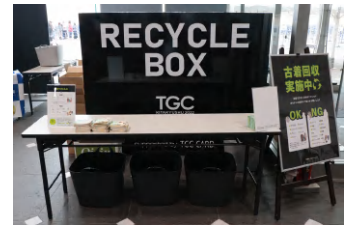
※TGC 北九州 2022の様子

回収した古着は、リサイクル工場にて一つ一つ手作業で仕分けし、再生繊維を製造。その再生繊維を原料に、自動車内装材（吸・遮音材）として高い付加価値のある素材にアップサイクルし、自動車メーカーに供給することで、 地域循環型のリサイクルを実現します。 是非、着なくなった古着を持ってTGC 北九州 2023にお越しください！