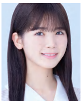
筒井あやめ（乃木坂46）