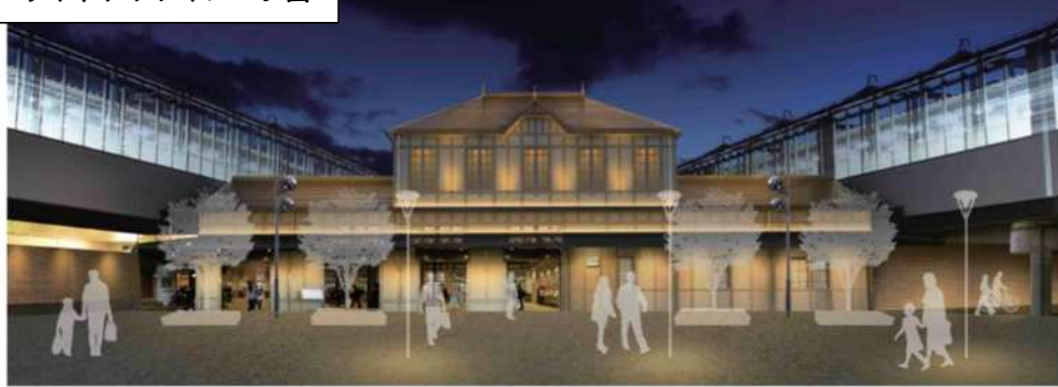
ライトアップイメージ図