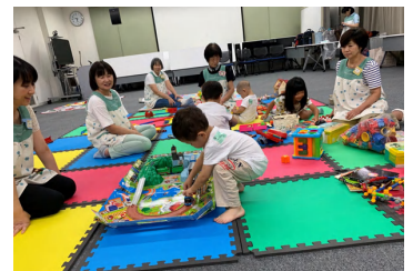
※TGC 北九州 2022の様子

NPO法人チャイルドケアサポートセンター（ママトモ魚町）TEL：093-967-0708（火曜日～日曜日10:00～16:00）