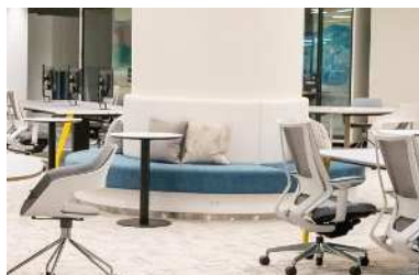
▲ 円柱にそったベンチシート