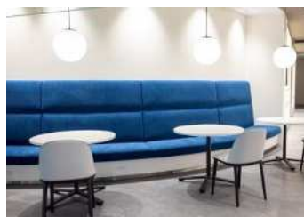
▲ 対面式ベンチシート