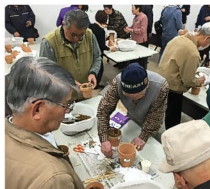
戸畑あやめの株分け講座の様子 (H28.2.13)

ウェルとばた、浅生1号公園、夜宮公園内の3箇所にあやめ花壇を増設し、また、浅生スポーツセンターの協力によりスポーツセンターの敷地内花壇でもあやめを育てていただくなど、より多くの方々に戸畑あやめを鑑賞し、楽しんでもらえる取り組みを進めています。