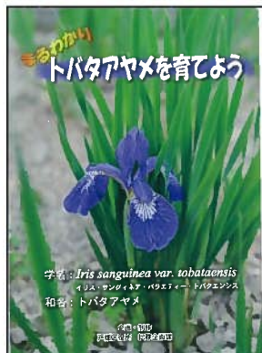
戸畑あやめの育て方 説明用DVD