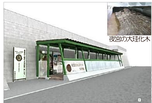
夜宮の大珪化木鑑賞施設

広葉樹の樹幹に珪酸が染み込んで石化したもので、昭和 22 年に国の天然記念物に指定されました。