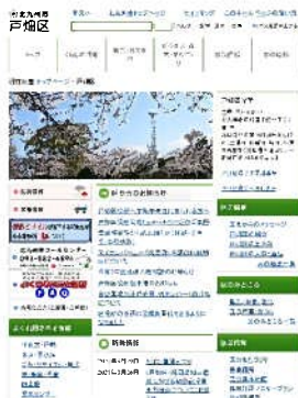
戸畑区役所ホームページ