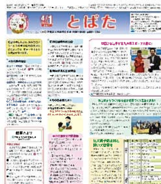
市政だより戸畑区版