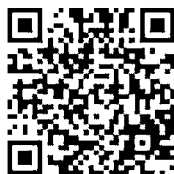
【市のホームページ】

市民の皆さまの要望、苦情、相談・問合せ、意見・提案などをメール、電話、窓口、郵便、FAX等で受け付けています。いただいたご要望等を関係機関へ伝えたり、アドバイス等の対応を行なっています。 北九州市のトップページからお入りください。