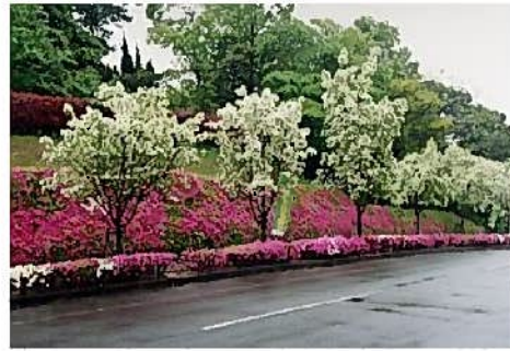
なんじゃもんじゃ通り

夜宮公園は戸畑区のほぼ中央の穏やかな丘陵地に広がる自然豊かな公園です。春の梅や桜、6月の花菖蒲、秋の紅葉と一年を通じて自然を楽しむことができます。