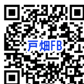
戸畑区役所 フェイスブック