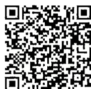
市ホームページ 【戸畑の近代化産業遺産】