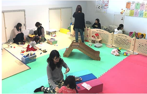
戸畑区役所2階の親子ふれあいルーム

子育て家庭の親とその子ども（概ね3歳未満の乳幼児）が気軽に集い、相互に交流を図る場として、子育て相談や講座の開催、子育て関連情報提供などの事業を実施しています。