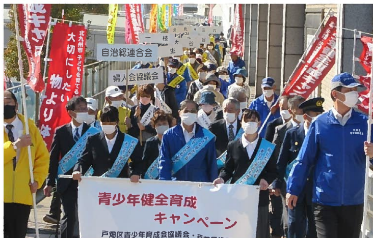
地域の皆さんによるパレードの実施

子どもたちの健全育成のため、戸畑区青少年育成会協議会を中心に、親子・地域ふれあい清掃、青少年健全育成キャンペーンなどの実施に取り組んでいます。