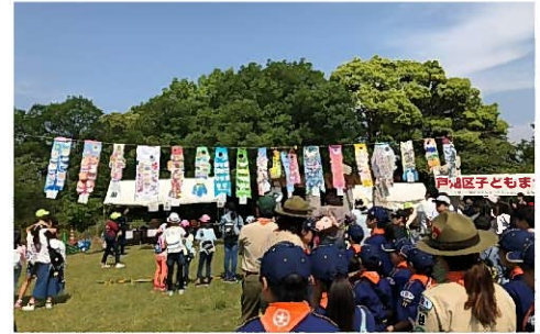
子どもたちが作成したこいのぼりを 会場で展示

地域全体で、子どもたちの健やかな成長を願うとともに、遊びを通じて楽しみながら、親子の絆や友情を深めていただくことを目的に、毎年開催しています。