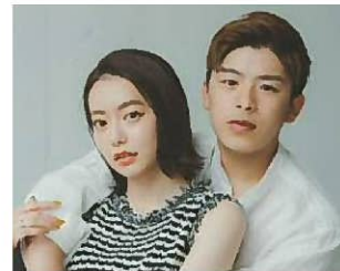
なこなこカップル