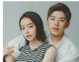
なこなこカップル