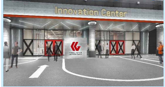
大型イノベーション施設 (イメージ)