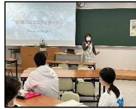
花壇の計画づくり