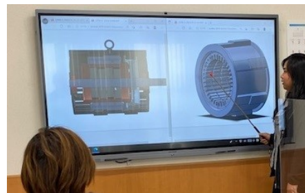
インターンシップ中の タイ人学生の活動の様子