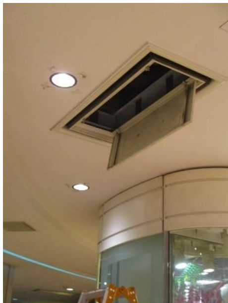
【落下時、蓋が開いた空調機】