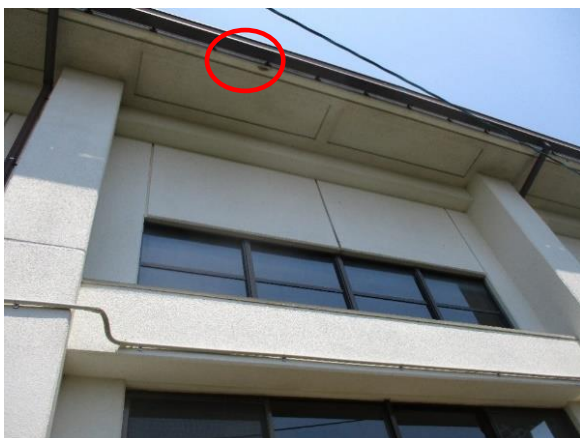
【高須児童館の軒下】