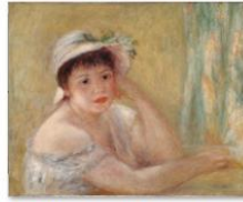
007ルノワール《妻むら帽子を振った女》1880年. jpg