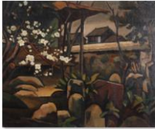
033古賀春江『神楽く庭』MG_0008.jpg