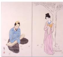
017竹久夢二「桐下別荘」.tif