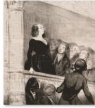
003ドミエ『シャリヴァリ』オデオン座sps 1405_2727.jpg