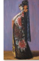
032児島善三郎『スペイン装』045_sps.jpg