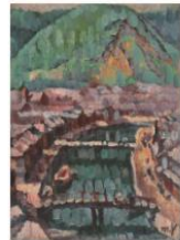
038柳瀬正夢『門司並立山より門司市場川我のそむ』jpg