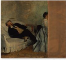
001エドガー・ドガ「マネとマネ夫人像」.jpg