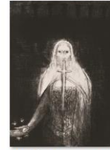
008ルドン『ヨハネ黙示録 1』sps 1405_2720.jpg