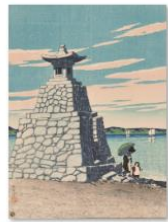
014川瀬巴水「筑前箱崎」sps 1405_2715.jpg