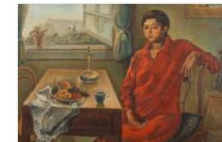
044青柳喜兵衛『几辺丹装』1929年.JPG