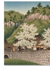
016川瀬巴水「豊後杵瀬」sps 1405_2717