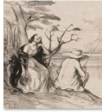
002ドミエ『シャリヴァリ』あいやだsps 1405_2729.jpg