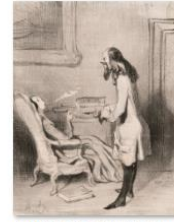
004ドミエ『シャリヴァリ』奥様sps 1405_2728.jpg