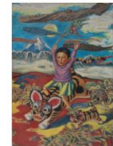
042青柳喜兵衛『天翔ける神々』1937年.JPG