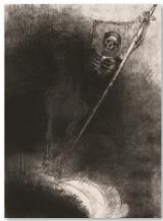
009ルドン『ヨハネ黙示録 III』sps 1405_2719.jpg