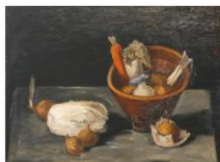
041青柳喜兵衛『厨扉にあるもの』1935年.JPG