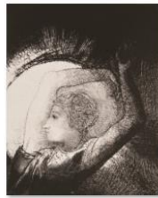
010ルドン『ヨハネ黙示録 VI』sps 1405_2718.jpg