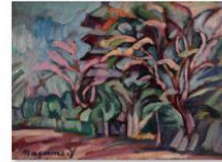
036柳瀬正夢『上野風景』1914_G3A0329.JPG