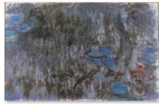
006Monet_Water Lilies, Reflections of Weeping Willows.jpg