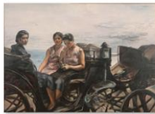
035中村研一『重を伴む』1932年.jpg