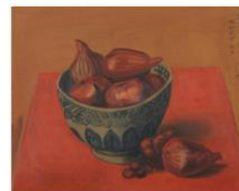
043青柳喜兵衛『無花果園』1932年.jpg