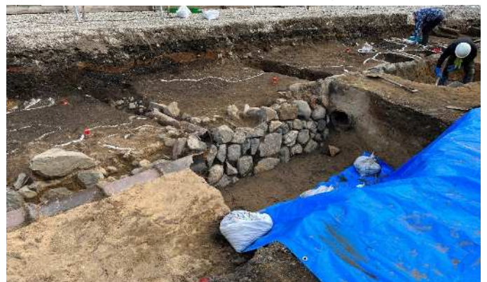
【発掘調査の様子（神嶽川護岸石垣跡）】