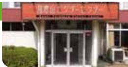
皿倉山ビジターセンター