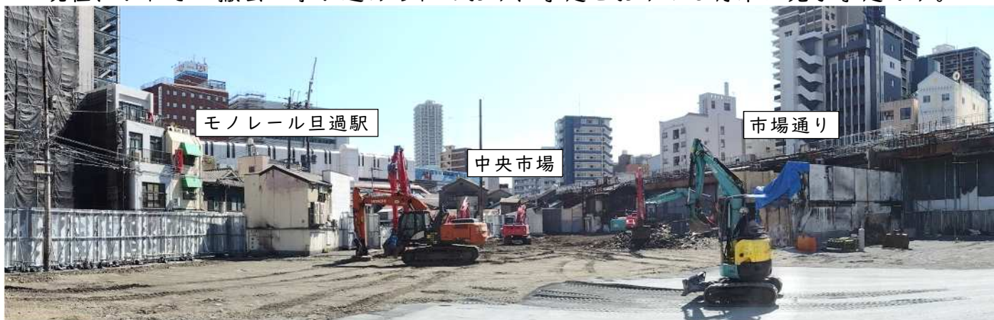
瓦礫撤去状況(9月30日時点)

神嶽川旦過地区整備室では、関係者の皆様に事業についての情報提供を行っています。質問等がございましたら、お手数ですが下記までご連絡ください。