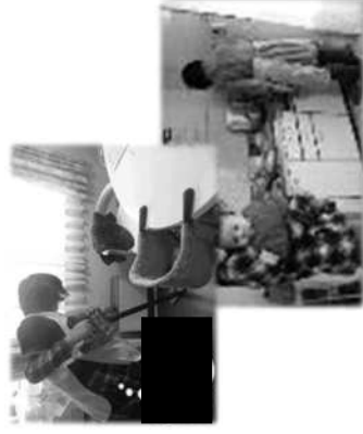
家事支援のイメージ