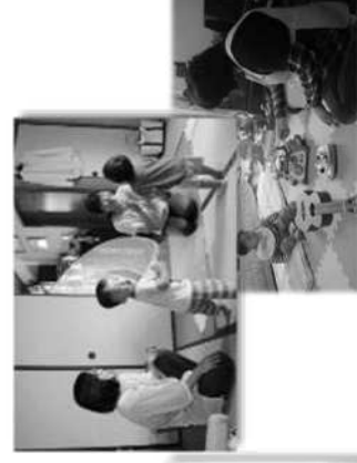
育児支援のイメージ