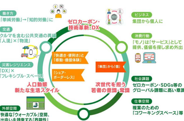
【これからの社会で「当たり前」になっていく価値観】