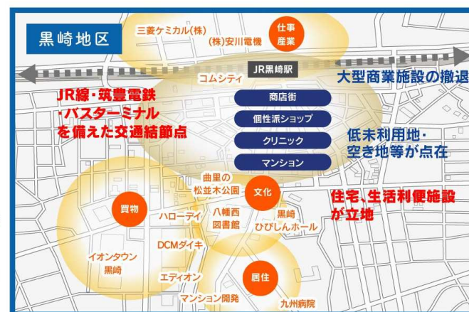
【地区の強みと課題】