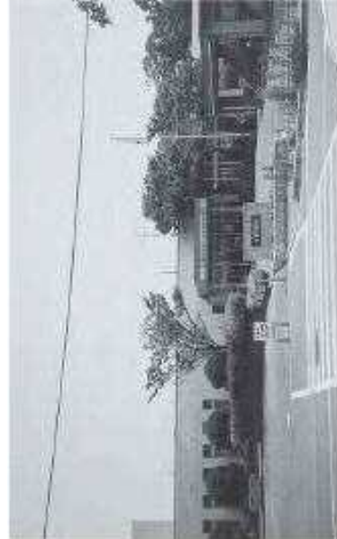
八幡西区役所上津役出張所