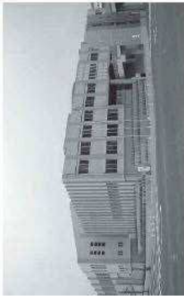
門司区役所松ヶ江出張所