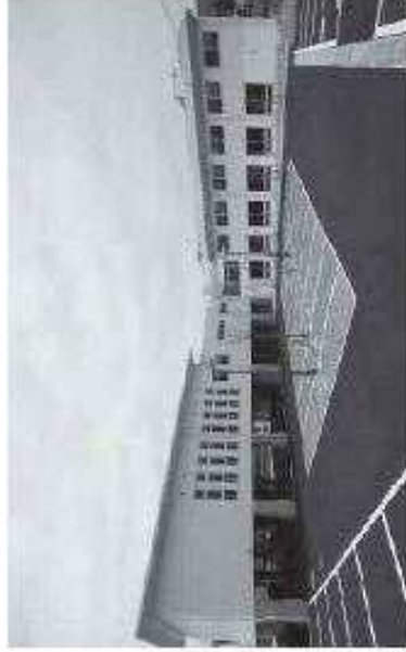
若松区役所島郷出張所