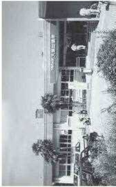
門司区役所大里出張所