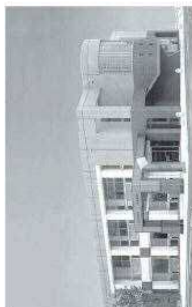
八幡西区役所折尾出張所