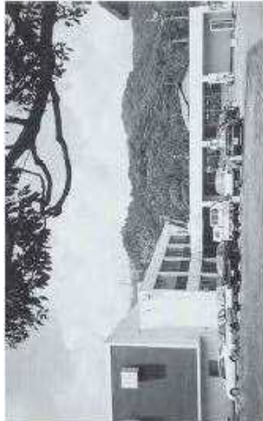
小倉南区役所東谷出張所