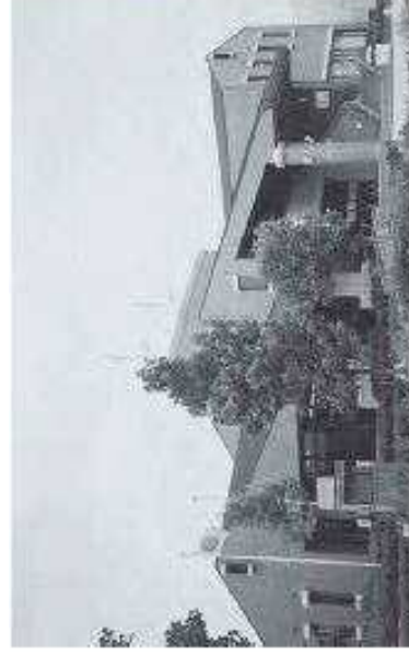
八幡西区役所八幡南出張所