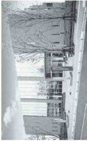
小倉南区役所曾根出張所