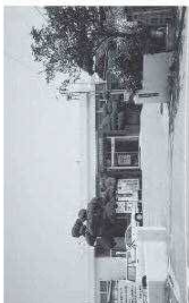
小倉南区役所両谷出張所