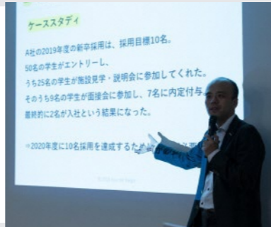
※昨年のプログラム時の様子です。今年はオンライン開催になります。