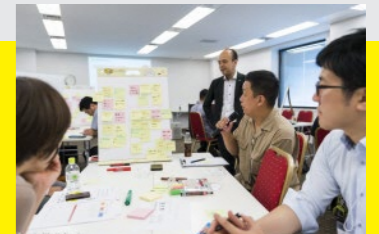
※昨年のプログラム時の様子です。今年はオンライン開催になります。