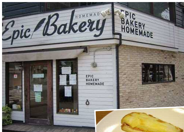
クロックムッシュと ウイナーソーセージ

以前は2階に、とてもシャレオツなウッド調のイートインスペースもありましたが、多忙につき現在は閉鎖中とのこと。ぜひ、再開してもらいたいものですね。