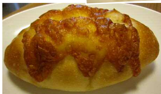
カマンベールチーズフランス (220円税込)