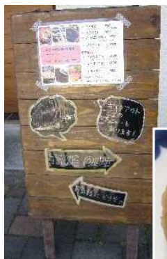
チーズパンケーキ ⇒ (130円税別)

惣菜パンから菓子パンまで、他店にないユニークなパンばかりで、何度通っても食べつくせないほどです。お散歩のついでにちょっと覗いてみませんか？