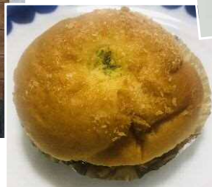
←たまご丸ごとパン (150円税別)