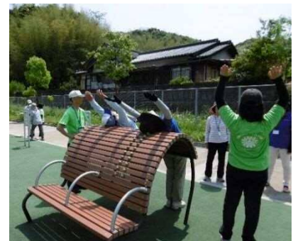
遊具の状況（長野緑地）