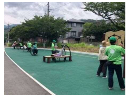
遊具の状況（朽網中央公園）