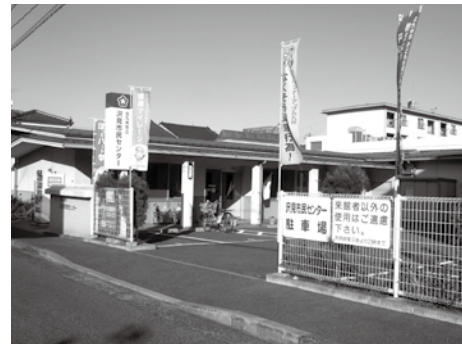
さわみしみん 市民センター

しみん ちいき ちゅうしん ばしょ 市民センターは、地域のまちづくりの中心となる場所です。 とばたかない げんざい しょ しみん 戸畑区内には現在、12か所の市民センターがあります。みな さんのこうくにも、1つか2つの市民センターがあると おもいます。 しょうがくせいむ かつどう きょうしつ かぞく ひと ともし 小学生向けの活動や教室もあります。家族の人や友だちと しみん 市民センターへあそびに行ってみませんか。