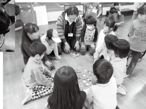
たいかい かるた大会