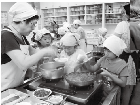
ちようせん 楽しいクッキングに挑戦!