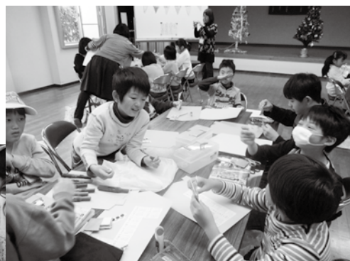
つく みんなでカレンダー作り