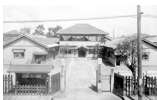
とばたまちやくば 戸畑町役場

も じ し こくらし やはたし わかまつし がっぺい きたきゅうしゅうとばたく 門司市・小倉市・八幡市・若松市と合併(※)して「北九州市戸畑区」となる