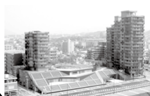
とばたくやくしよ ねん 戸畑区役所(2007年から)