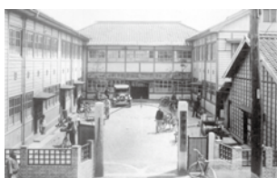
とばたしやくしよ ねん 戸畑市役所(1933年まで)