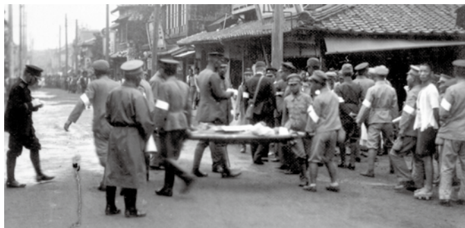
ねん しょうわ ねん ぼうくうえんしゅう 1936年(昭和11年)ごろの防空演習

さらに、1944年(昭和19年)6月からは、 たびたびアメリカ軍の空襲を受け、家が焼か れたり、ビルや工場が壊されたりしました。 くうしゅう いのち お ひと おお おお ひ 空襲のため命を落とした人も多く、大きな被 がい で 害が出ました。