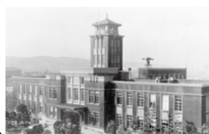
とばたし くやくしよ 戸畑市/区役所 (1934年から2006年)