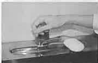
7 水道の栓を止めるときは、手肘か肘で止める。できないときは、ペーパータオルを使用して止める