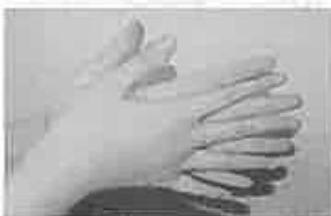
1 手のひらを合わせ、よく洗う