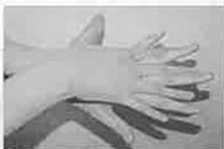
2 手の甲を伸ばすように洗う