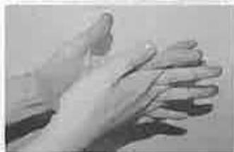
4 指の間を十分に洗う