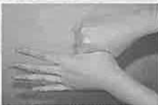
5 親指と手掌をねじり洗いする