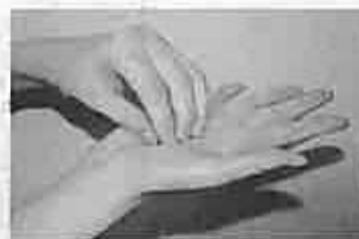
3 指先、爪の間をよく洗う