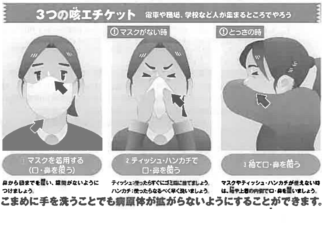
図3 咳エチケットについて