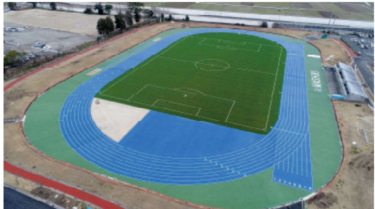
益城町総合運動公園陸上競技場（復旧後）

陸上競技場（サッカーグラウンド）及びテニスコートにおける路盤工、アスファルト舗装工の施工については、広