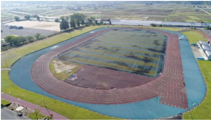
益城町総合運動公園陸上競技場（復旧前）

大きな施工面積で数mm単位の精度管理が必要となるため、施工業者からの技術提案により情報化施工システム（自動追尾光波測定器マシンコントロール）を採用することにしました。これにより操作員の技量に左右されることなく高い施工品質と生産性を安定的に確保できました。無事工期内に完成できたのも、施工実績、高度な施工技術がある運動施設専門の施工業者のおかげだと感謝しています。