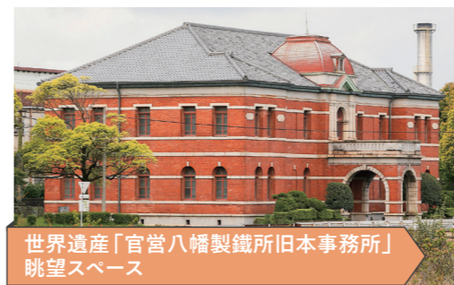
世界遺産「官営八幡製鐵所旧本事務所」眺望スペース

2015年に世界遺産に登録された「明治日本の産業革命遺産 製鉄・鉄鋼、造船、石炭産業」の構成資産の一つ「官営八幡製鐵所旧本事務所」を眺望スペースから見学することができます。官営八幡製鐵所や旧本事務所について、デジタルサイネージやVRなどを使って分かりやすく解説しています。