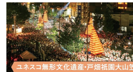
ユネスコ無形文化遺産・戸畑祇園大山笠

2015年に世界遺産に登録された「明治日本の産業革命遺産 製鉄・鉄鋼、造船、石炭産業」の構成資産の一つ「官営八幡製鐵所旧本事務所」を眺望スペースから見学することができます。官営八幡製鐵所や旧本事務所について、デジタルサイネージやVRなどを使って分かりやすく解説しています。