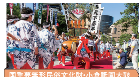
国重要無形民俗文化財・小倉祇園太鼓

小倉城を築城した細川忠興公が、京都の祇園祭を模して始めたといわれる、勇壮・優美な太鼓祇園。にぎやかなジャンガラ(摺り鉦)と、全国的にも珍しい太鼓の両面かつ歩行打ちが特長です。7月第3土曜日を挟む前後3日間で開催。