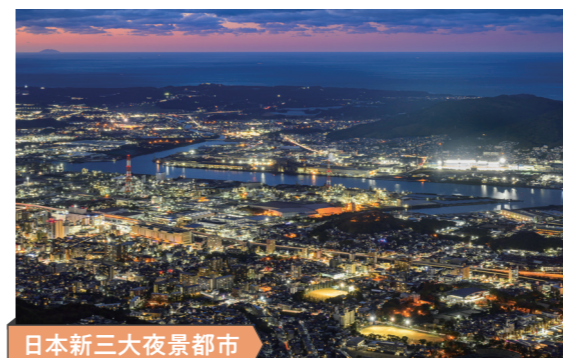
日本新三大夜景都市

2022年3月、北九州市は夜景の素晴らしい街として「日本新三大夜景都市」に全国1位で認定されました。認定は3年に一度あり、2018年に続き、2度目の認定となります。(写真は皿倉山からの夜景)