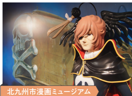
北九州市漫画ミュージアム

戦後日本を代表する、北九州市出身の作家・松本清張の偉大な業績を称え、その生涯や作品を紹介しています。また、東京都杉並区の自宅の書斎、応接室、書庫の再現展示もしています。