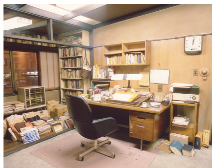
地元ゆかりの作家を顕彰「松本清張記念館」

1602年に細川忠興公が築城。「唐造り」の天守閣や、切石を使わない「野面積み」の豪快な石垣が特徴です。