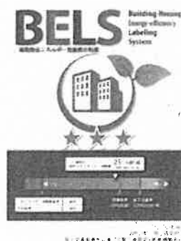
[図1] ガイドラインに基づく第三者認証の例

また、ダイヤモンドリスponsに対応した時間帯別・季節別の電気料金メニューが選択できる場合はその活用に努めるとともに、エネルギー管理システム（BEMS・HEMS等）の導入により、ビルの運用方法、住宅の住まい方の改善によるピーク対策及び省エネルギーに努めること。