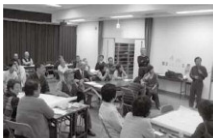
▲地域の健康講話で健康課題や予防について学習することで市民の健康意識が高まり、人材育成にもつながります。