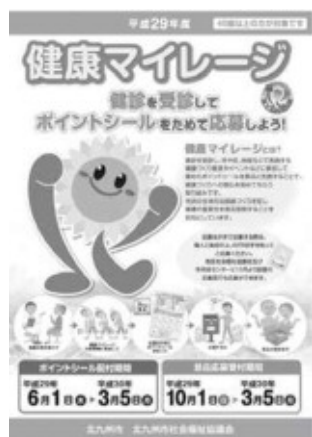
健康マイレージ事業

住宅の室内環境を整えてヒートショックなどを防ぐ断熱改修や、自立した生活を送り続けられる健康寿命を伸ばすバリアフリー改修など、「健康な住まいづくり」の普及を促進するため、住宅の改修に対する助成や啓発セミナーなどに取り組みます。