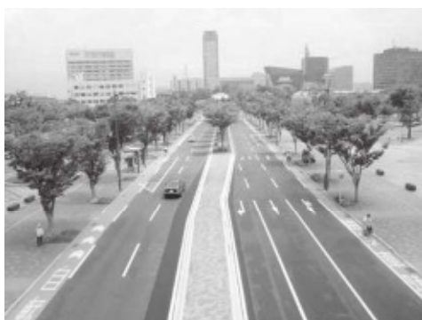
▲小倉北区の「清張通り」に設置された自転車レーン