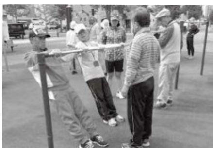
▲健康遊具の整備後は、周辺住民に対して運動教室を開催しています。