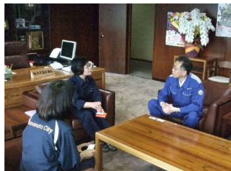
熊本市議会を訪問する戸町議長

熊本市議会藤岡照代副議長を訪問し、お見舞いを申し上げ、市議会議員全員から集めた義捐金をお渡しした。（義捐金は、九州市議会議長会を通じて被災地へ送付。）