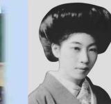
杉田久女・橋本多佳子のPR・顕彰

2 現実とイメージのギャップの解消を目指した 日本トップクラスの安全・安心なまちづくり