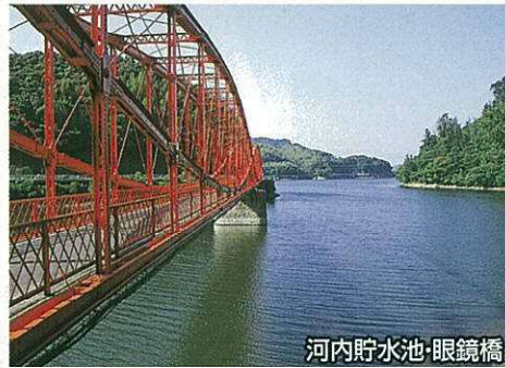
河内貯水池・眼鏡橋