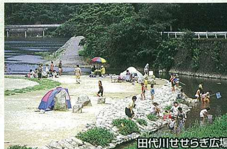
田代川せせらぎ広場

国定公園の一部に指定された河内地域は、河内貯水池を中心に四季折々の緑の景観が美しい行楽地です。血倉山、権現山などの山々に囲まれた最高のロケーションの中でバードウォッチングや、野草の観察等が楽しめます。清流が貯水池に流れ込む付近には広場や休憩舎が整備され、貯水池のほとりには俳人・山頭火の句碑も建てられています。