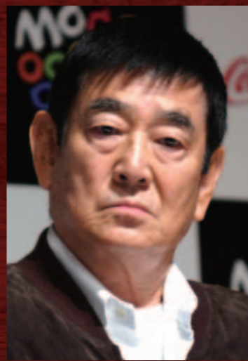
眼で語れる名優だった

フリー転向後は『八甲田山』『幸福の黄色いハンカチ』『鉄道員(ぽっぽや)』などの重厚な演技で国民的大スターの地位を確立しました。平成25年、文化勲章を受章。