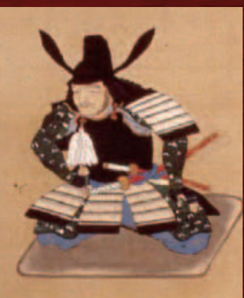
絹本着色黒田二十四騎図 井上周防之房(春日神社所蔵)