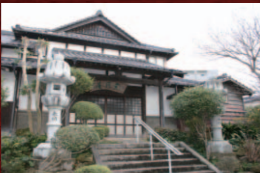
舎月庵。(見学不可) 井上周防之房が移り住んだ屋敷跡

官兵衛の系譜を引く歴史遺産のまち、黒崎。黒崎城址や之房の隠居所跡に建つ「舎月庵」、栗山善助の子・大膳が手がけた「堀川」など、周辺には関連の史跡が多く見られます。勇壮な黒崎祇園太鼓の音色にも、幾多の合戦で黒田勢が用いた陣太鼓の響きが重なるようです。