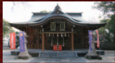
官兵衛、長政と二十四騎を祀る春日神社

の「軍師」として活躍、秀吉の天下統一を支えました。1586(天正14)年の秀吉の九州平定戦では軍監として九州に初上陸。毛利・吉川・小早川軍とともに小倉城を攻撃、開城降伏させています。中津城主となった官兵衛は隠居後、剃髪して如水の法名を名乗り、家督を息子の長政に譲りました。1600(慶長5)年、関ヶ原の戦いでは兵の大半を長政に与え、家康につき従わせます。官兵衛自身は豊後国石垣原(大分県別府市)の戦いで大友義統に勝利すると九州を席卷、一説には彼はこのとき、関ヶ原の混乱に乗じて自らが天下取りを狙った