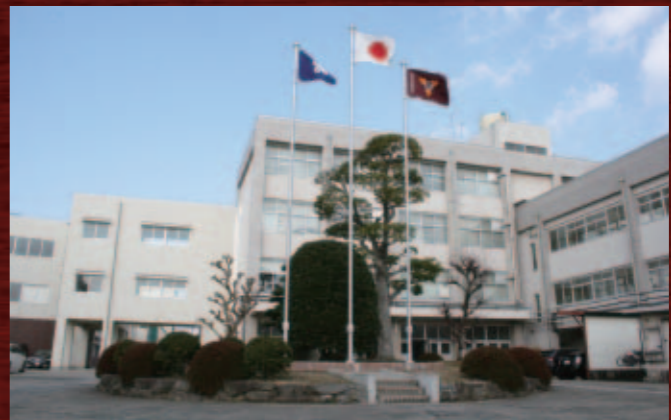
高倉(小田)青年が通った県立東筑高校

『網走番外地』シリーズ、『昭和任侠伝』シリーズなどで看板俳優となった彼でしたが、切った張ったの役柄に飽き足らず、昭和51年には東映を退社。