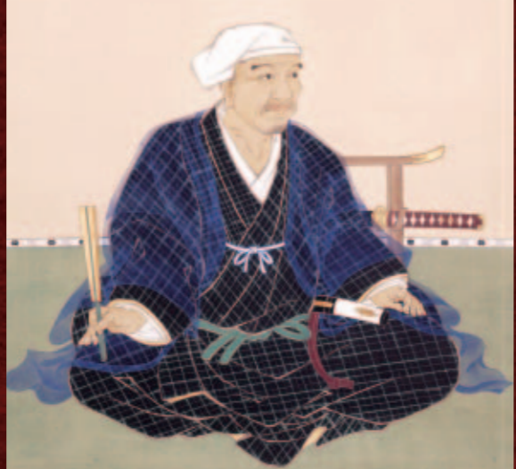
黒田如水像(福岡市博物館所蔵)