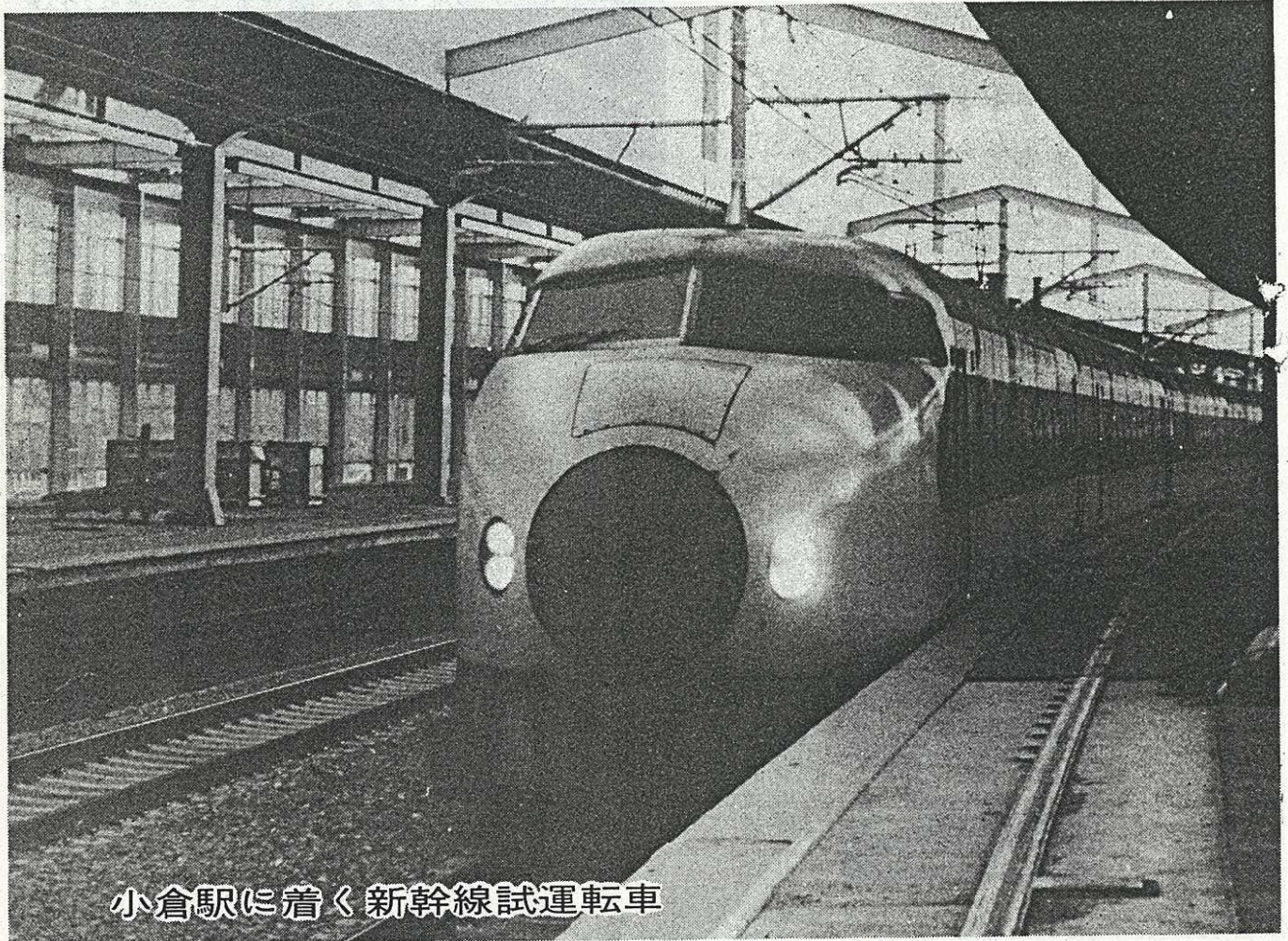
小倉駅に着く新幹線試運転車