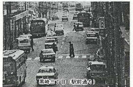
黒崎三丁目（駅前通り）