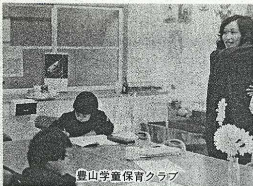
豊山学童保育クラブ

費用は億を超えると思えます。改造するとなりますと半年ぐらい休館しなければなりませんので実施時期は慎重に考えていきたいと思っております。