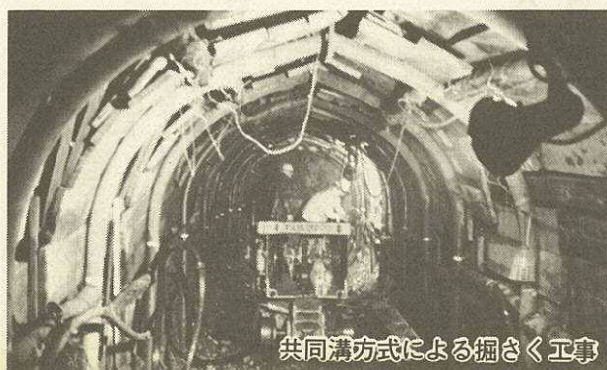
共同溝方式による掘さく工事

建設局長 ガス会社には、通常の場合、ガス事業法に定められている、年一回の定期検査と年六回の定期巡視を行い、計画的に老朽管を替えるよう指導しています。このたびの事故を教訓として、ガス会社には特に、次の三点について指導を行っています。