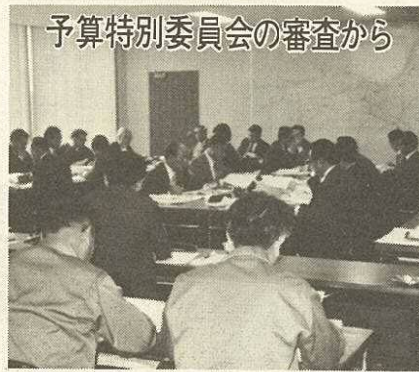
予算特別委員会の審査から

ため、紫川の架橋建設を考えたいと思っています。建設時期は、橋の工法上の問題あるいは紫川東岸にある家屋の立退き問題等があるため、都市計画道路小倉駅・大門線の整備より多少遅れるのではな